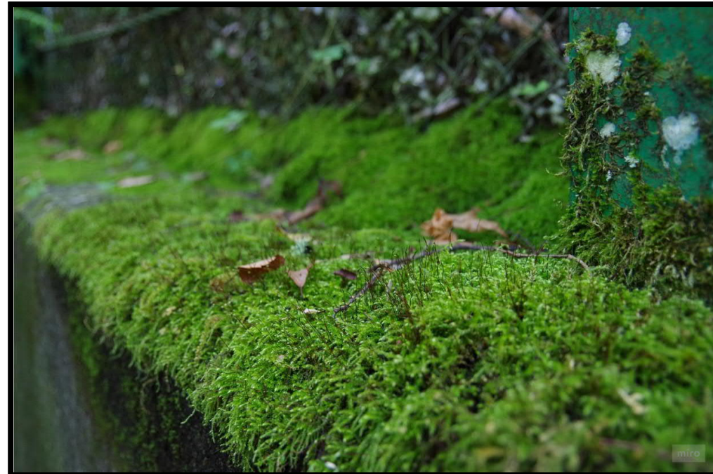
Kuva: Kuvituskuva. Havainnekuva konseptista on tekeillä.

Prototyyppiratkaisu - pilottikohteita etsitään parhaillaan!